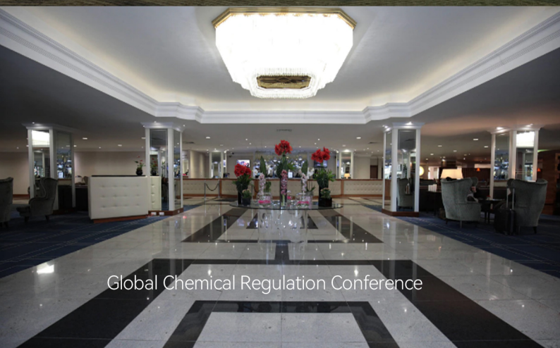
Global Chemical Regulation Conference